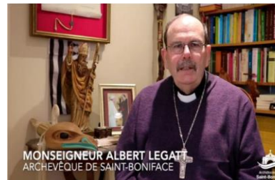
MONSEIGNEUR ALBERT LEGAT ARCHEVÊQUE DE SAINT-BONIFACE

Dimanche 6 octobre 2024 – 27 e dimanche du temps ordinaire « Cycle B » Sunday October 6 th , 2024 – 27 th Sunday in Ordinary Time 'Cycle B'